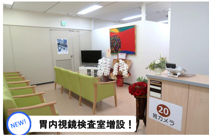
NEW! 胃内視鏡検査室増設！